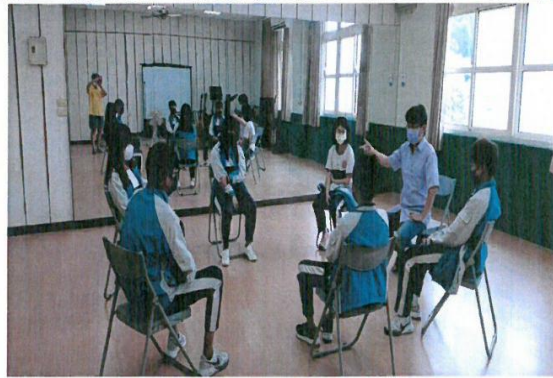
團體規約與目標動力說明