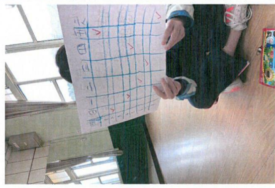
以圖表呈現個人一周的抽菸頻率