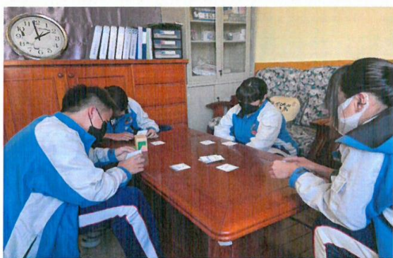
透過能力強項卡了解自我能力