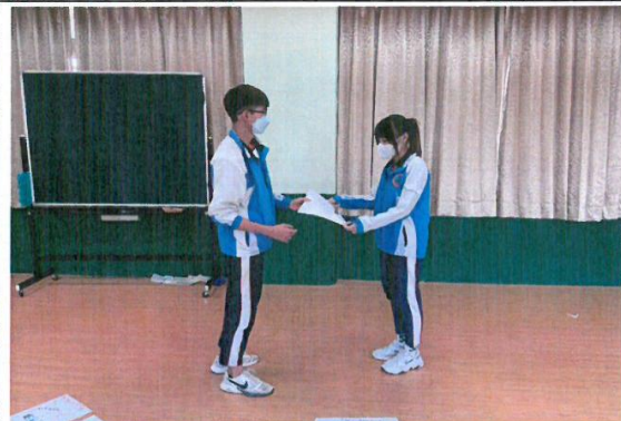
成員互贈手繪禮物並給予祝福語